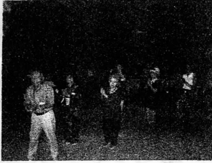
4丁目夕涼み会盆踊り風景

は現在 うたごえ 囲碁 社交ダンス 茶道 グランドゴルフ パソコン ヨガ えしごと ボランティア 謡曲(休会中)等9つのサークルがありますが、近くゴルフ マージャン カラオケ 吹き矢のサークルを立ち上げる予定です。また、俳句、川柳のサークルも計画中です。