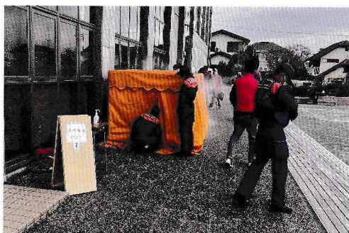
濃煙体験 (南消防署)