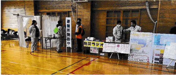
藤沢市による避難所等のブース