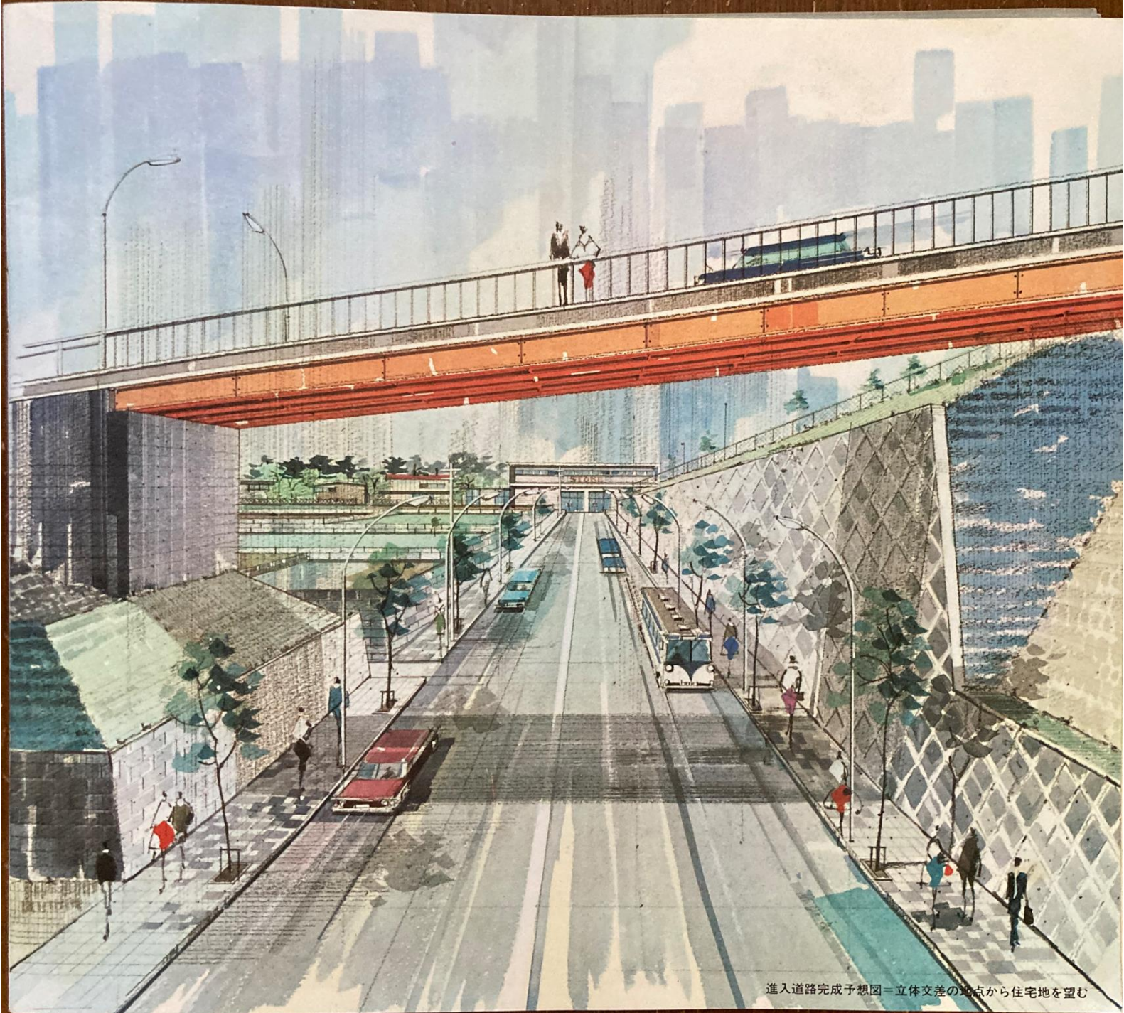
進入道路完成予想図—立体交差の地点から住宅地を望む