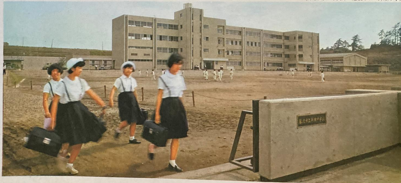
《片瀬山》の中央部に建設された片瀬中学校

市と協力して30,000人分の污水处理可能な川袋ポンプ場と1kmにおよぶ圧送パイプを 現在建設中です（供用開始予定 昭和43年4月） 《片瀬山》に住む人だけでなく 附近一带の人たちも含めて 市の污水处理地域を飛躍的に広めたのです