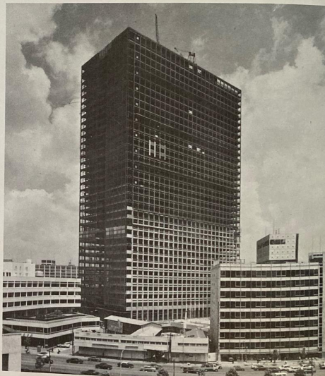
昭和三十二年五月二十九日撮影

これら次々と輝かしい金字塔をうちたてた三井のエネルギーは、不動産業界のパイオニアとして、とどまることを知りません。