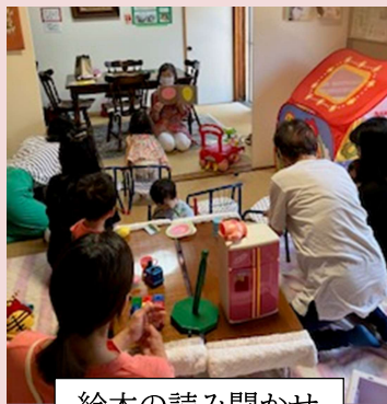
絵本の読み聞かせ